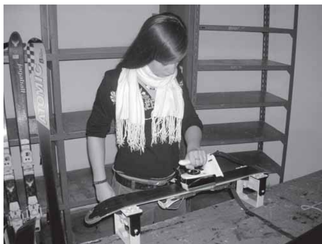
Vor das Gleiten haben die Götter das Bügeln gesetzt.