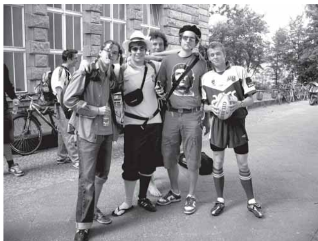
Mottotage: Der Phantasie wurden keine Grenzen gesetzt.